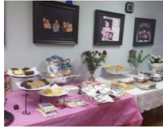
Junto con el vino y el queso, se produjo una exposición maravillosa de comida! (Celebración del Día de la Madre)

Nos reunimos en el Rainforest Cafe en el área de Galleria. Nuestro padres al igual que chicos disfrutaron los sonidos y el medio ambiente de la selva. Para completar la noche, tuvimos en nuestra mesa un postre Volcán que fue un gran éxito con los niños.